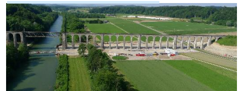
Aus alt mach neu: Der Saaneviadukt wird saniert und auf Doppelspur ausgebaut.

Infos zum Bauprojekt: bls.ch/saaneviadukt