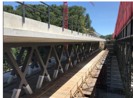
Nach der Demontage der alten Stahlfachwerkbrücke wird die neue Brücke an die definitive Lage verschoben.