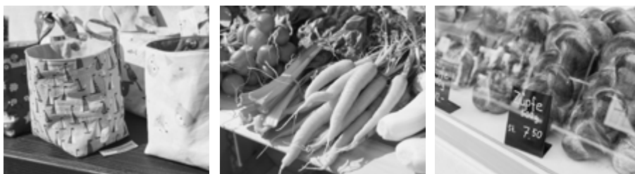
Impressionen vom vorjährigen Neuenegger Dorfmarkt

Das Organisationsteam freut sich, Sie am Dorfmarkt begrüssen zu dürfen. Weitere Informationen finden Sie unter www.neuenegger-dorfmaerit.ch .