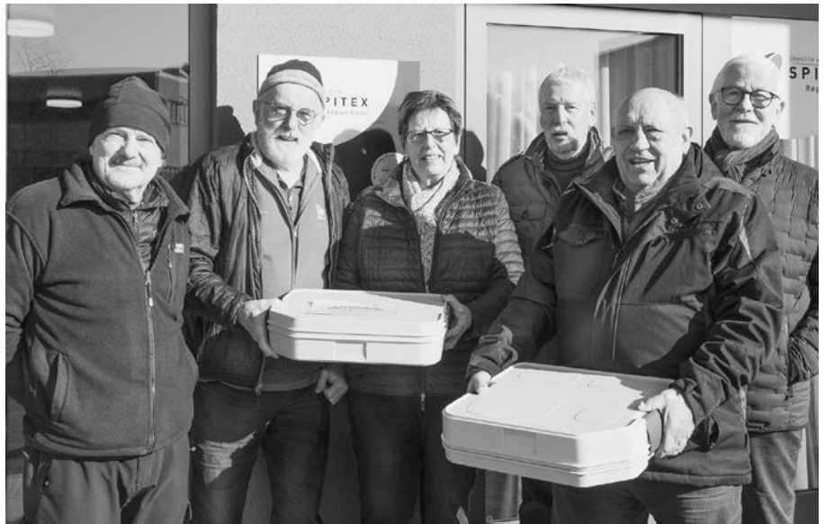
Einige Fahrer/innen Mahlzeitendienst SPITEX Region Köniz