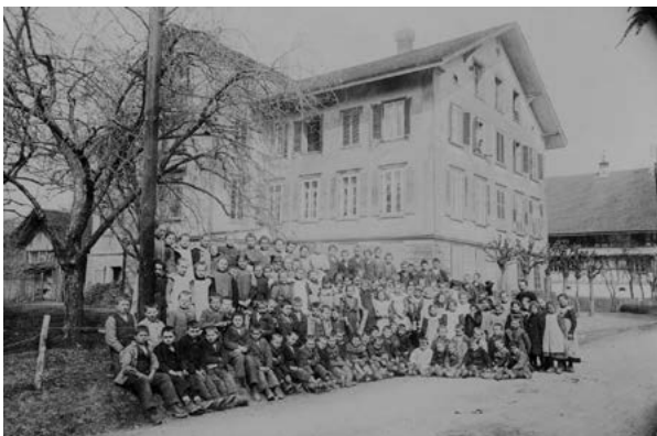
Vor ca 100 Jahren - die Schülerinnen und Schüler beim Schulhaus im Dorf

«Neuste» Fotos in unserer Sammlung... (1. März 2023)