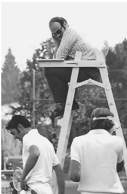
1970: Wir hatten schon damals Hawk-Eye, aber vom Hochsitz aus