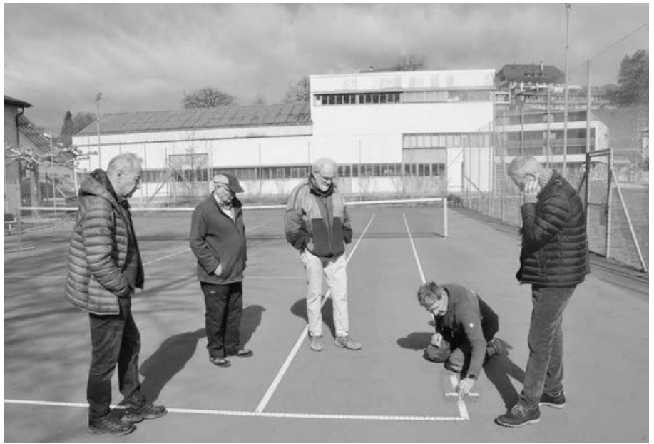
Der Fachmann erklärt den Aufbau der Spielfläche

davon musste einer Firmenerweiterung weichen, der andere blieb all die Jahre bestehen und wurde in den 1970er-Jahren sanft renoviert. Eine umfassende Sanierung wäre in den nächsten Jahren unumgänglich gewesen. Das war der Anstoss zur Idee, einen topmodernen Allwetter-Sandplatz mit einer automatischen Bewässerung und einer neuen Beleuchtungsanlage zu realisieren. Nach eingehender Prüfung verschiedener Tennisplätze wurde das System Swiss Court der Firma Joseph als das Beste evaluiert und bestellt. Die Vorteile gegenüber einem klassischen Sandplatz sind offensichtlich. Insbesondere kann der Platz auch bei feuchtem Wetter bespielt werden. Dadurch verlängert sich die Saison merklich. Der Platz ist robuster und auch weniger unterhaltsintensiv. Den Hauptteil der Projektkosten übernimmt der Dr. Albert Wander-Fonds. Die Firma Wander AG und der Sportverein werden einen Teil der Kosten die nächsten zehn Jahre in Form einer jährlichen Nutzungsgebühr beitragen. Erfreulicherweise wurde das Vorhaben auch von der Gemeinde Neuenegg und von SWISSLOS/Sportfonds