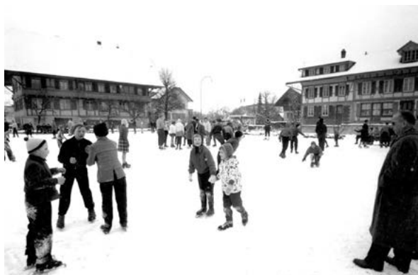
Winter 1956 | 1957 - auf dem neu entstandenen Dorfplatz wird «gschlöflet» - eine grosse Freude für Jung und Alt!