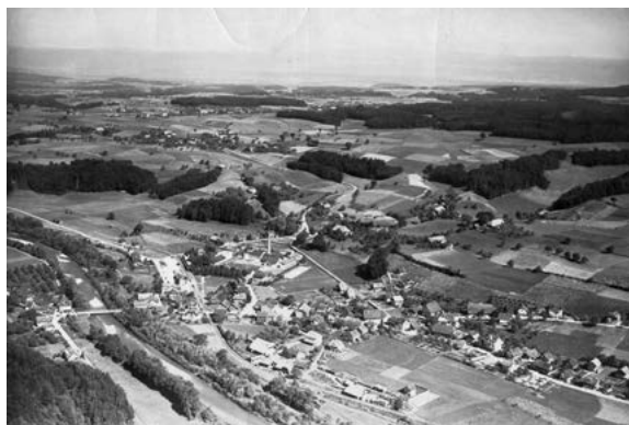
Vor 1938 - Flugaufnahme von Neuenegg