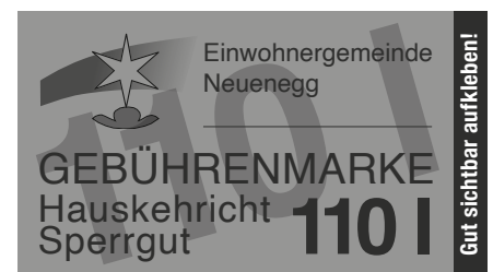
Erscheinungsbild Gebühren- und Sperrgutmarken