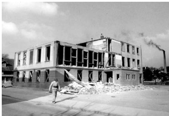
März 1956 - das alte Schulhaus im Dorf wird von der Luftschutz RS aus Freiburg abgerissen - mehr Bilder auf www.pro-neuenegg.com