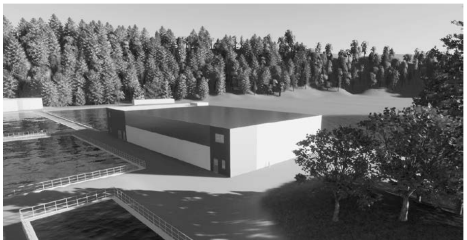
Visualisierungen der neuen GAK-Filtration