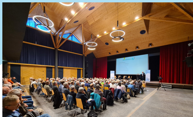
Die EKT finden im ganzen Kanton statt.

Die Energie- und Klima-Talks finden im ganzen Kanton statt – vor Ort oder online. Die Exper-tinnen und Experten beantworten während der Podiumsdiskussion Fragen, die die Teil-nehmenden bereits bei der Anmeldung oder im Chat eingeben oder vor Ort stellen. Beim anschliessenden Apéro können Vorhaben mit den Fachleuten oder anderen Teilnehmenden diskutiert werden.